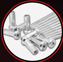
ชุบโครเมียม